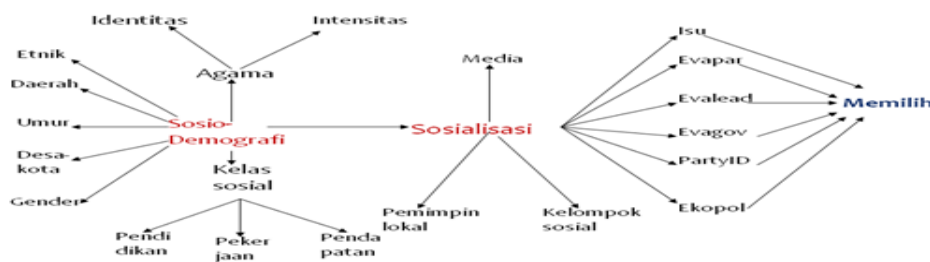
Picture 3. Rational Choice Model